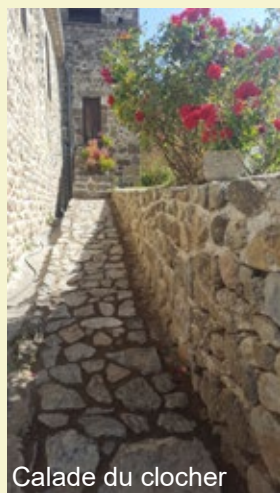
Calade du clocher