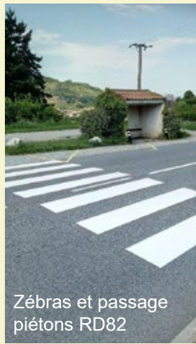
Zébras et passage piétons RD82