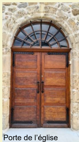
Porte de l'église