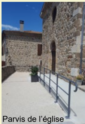
Parvis de l'église