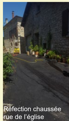
Réfection chaussée rue de l'église