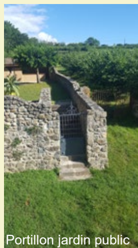
Portillon jardin public