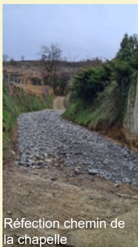
Réfection chemin de la chapelle